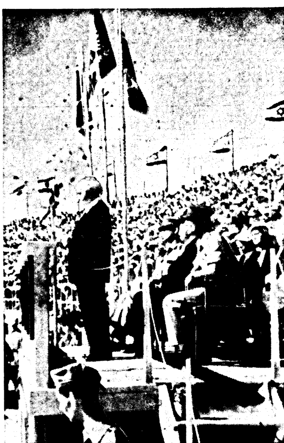
Op de tiende verjaardag van de stichting van de staat Israël heeft premier David Ben Goerion — de witte haren wapperend in de lichte bries — in het versierde stadion van Jeruzalem een grote menigte burgers en militairen toesproken.

Volgens de Deense zelfverloofde is een Deens-Nederlandse prijsoorlog op de Westduitse kaasmarkt op handen. Verwacht wordt dat hierdoor de wereldmarkt verder zal inzakken. Woordvoerders van het centrale zuivelbureau te Aarhus zeiden dat volgens berichten uit Nederland de Nederlandse kaasproducenten van plan zijn de kaasprijs te verlagen. Zij zeiden dat de Deense producenten gedwongen zouden zijn dit voorbeeld onmiddellijk te volgen. West-Duitsland is de voornaamste afnemer van Deense kaas. Ongeveer de helft van de Deense kaasexport komt daar op de markt. In de laatste jaren heeft Denemarken zich een plaats naast Nederland veroverd op deze markt.